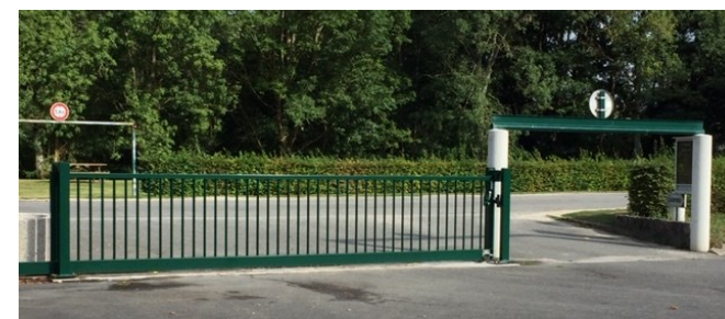
SÉCURISATION DE L'ENTRÉE DE LA SALLE POLYVALENTE